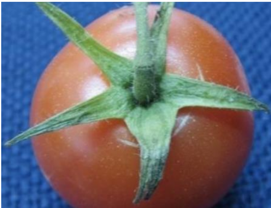
Srostlé lístky kalichu